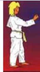
MONTONG AN MAKI