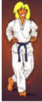
TUIT KOA SOGUI