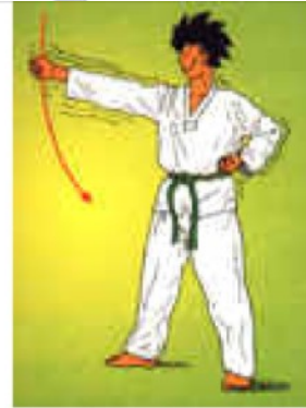
ME CHUMOK NERYO CHIGUI