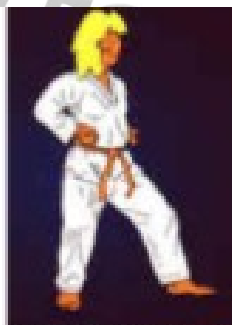
TUIT KUBI SOGUI