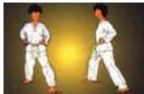
AP KUBI SOGUI