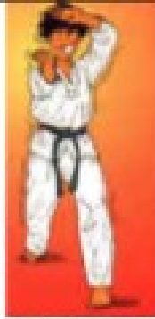
CHEBI PUM MOT CHIGUI

Kibon chumbi/ Chebipum mok chigui/ Montong piochok palkup chigui