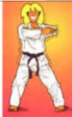
PALKUP PIOCHOK CHIGUI