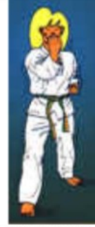
DUNG CHUMOK OLGUL APE CHIGUI