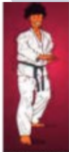
PYON SON KUT SEUO CHIRUGUI