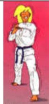
DOLLYO PALKUP CHIGUI